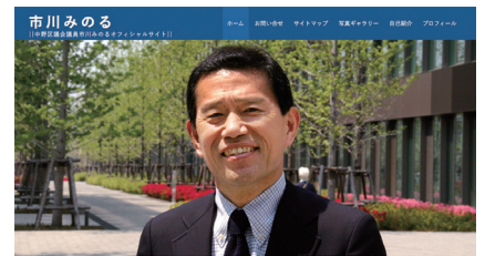
インフォメーション